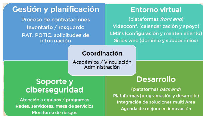
Cuadro de distribución de comunicación

Se aclaró que el nuevo sistema de telecomunicación en sustitución de Bluejeans será zoom, para tal efecto se capacitará al personal para que aprendan a usarlo. También se indicó que la nube de one drive sigue vigente.