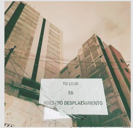
Foto: Barrio Antiguo, Monterrey, 2023.

Se otorgará un Diploma oficial de participación con valor curricular.