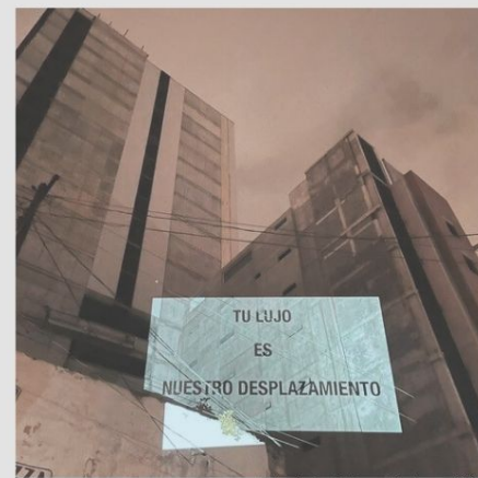
Foto: Barrio Antiguo, Monterrey, 2023.

Costo: $3,000.00 Mx. (Pago en 2 exhibiciones) $2,400.00 (Pago en una sola exhibición)